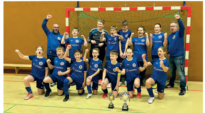
Die Fotos zeigen die glücklichen Gewinner

Alle Beteiligten hoffen, nächstes Jahr, in welcher Form auch immer, den „Twister Hallen-Gemeindepokal“ wieder durchführen zu können, um gemeinsam den Twister-Kindern, vor Ort, sportliche Highlights, anbieten zu können.